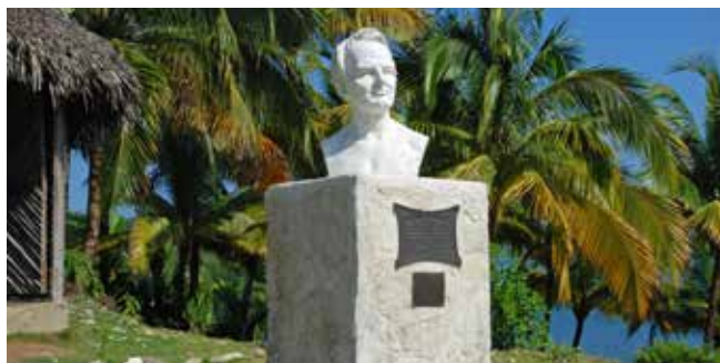
Bild links: Das Humboldt-Haus in Havanna; Bild rechts: Die Humboldt-Statue im Humboldt-Nationalpark in Kuba.

Im Rahmen der Informationsfahrt werden die kulturellen Höhepunkte der Hauptstadt Havanna besichtigt und auch das Humboldt-Haus ( Bild links ) besucht, das sich mitten in der Altstadt, in „Habana Vieja“, befindet, wo Alexander von Humboldt während seines Aufenthalts in Kuba gewohnt hat. Von Havanna aus sind Ausflüge geplant, bei denen weitere wichtige Stationen Alexander von Humboldts auf Kuba besucht werden, aber auch bekannte Sehenswürdigkeiten der Karibikinsel. Sollte Ihr Interesse an einer Teilnahme an der Reise „Auf den Spuren Alexander von Humboldts in Kuba“ vom 10. bis 17. Februar 2018 geweckt sein, wird darum gebeten, sich schon jetzt mit dem Kulturforum unter der Rufnummer 0921/76430-15 in Verbindung zu setzen.